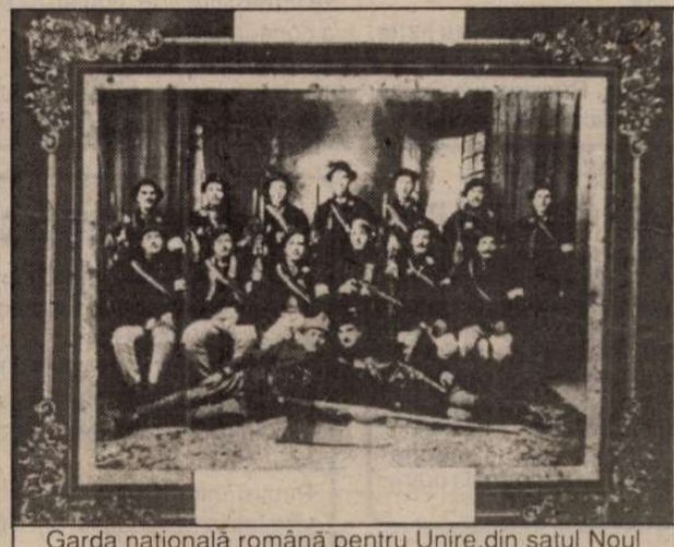
Garda națională română pentru Unire, din satul Nou Român (județul Sibiu) - nov. 1918

imponderabile, de impulsuri momentane... La tot cazul, vom convoca o Conferință națională, conform tradițiilor noastre. Acolo întregul popor român va fi reprezentat, prin delegații trimiși de fiecare circumscripție electorală, din toate ținuturile românești ale Transilvaniei, Banatului și Ungariei... Cred, Alteță Imperială, că, după toate câte am avut onoarea să vă expun, dispoziția în sânul întregii națiuni române, astăzi, e de așa, încât, dacă nu, cu unanimitate, dar cu aproape unanimitate, toți românii vor vota pentru unirea lor cu România". La demonstrația arhiducelui că și România are interesul "ca